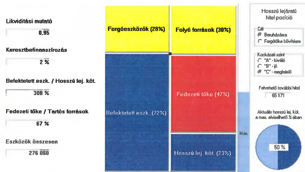
BKM Zrt. 2025.12.31. terv - Finanszírozási mérleg [1000 x ezer Ft]